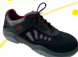
„ATLAS ALU-TEC 322 REDLINE“ S1-Sicherheitsschuh Größe 39 bis 49