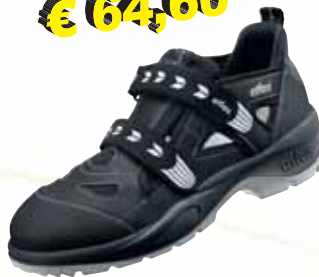
„ATLAS ERGOTEX 350“ S1-Sicherheitssandale Größe 36 bis 50