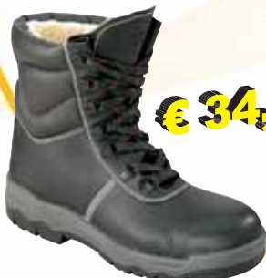
„WINTER SCHNÜRER M. FELL“ S3-Sicherheitsstiefel Größe 39 bis 47