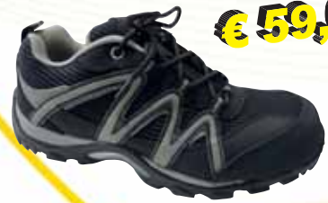
„JB COMFORT“ S1P-Sicherheitsschuh Größe 39 bis 47