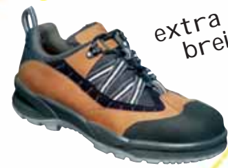
„STABILUS 1385“ S1-Sicherheitsschuh mit Lederfußbett Größe 39 bis 47