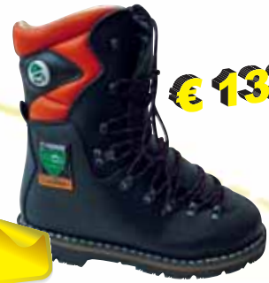
„ATLAS CL 570“ S2-Sicherheitshochschuh Größe 36 bis 49