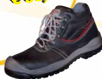
„HAITI“ S3-Sicherheitsschuh Größe 36 bis 48