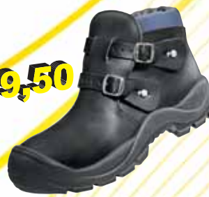
„ATLAS DUO SOFT 765“ S3-Schweißerschuh Größe 39 bis 48