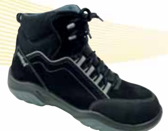
„ATLAS ALU-TEC 660“ S2-Sicherheitsschuh Größe 36 bis 49