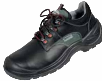
„FORMAT“ S3-Sicherheitsschuh Größe 38 bis 48