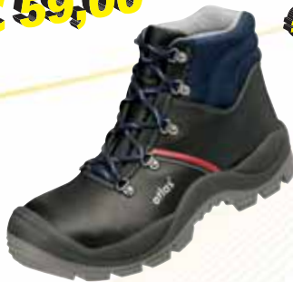
„ATLAS ANATOMIC BAU 500“ S3-Sicherheitshochschuh Größe 39 bis 50