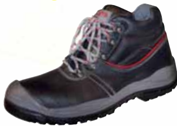
„CYPRUS“ S3-Sicherheitshochschuh Größe 36 bis 48