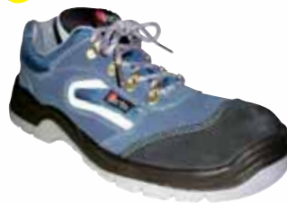
„CURLING“ S1-Sicherheitsschuh Größe 38 bis 47