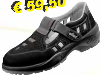
„ATLAS ERGOTEX 360“ S1-Sicherheitssandale Größe 36 bis 49