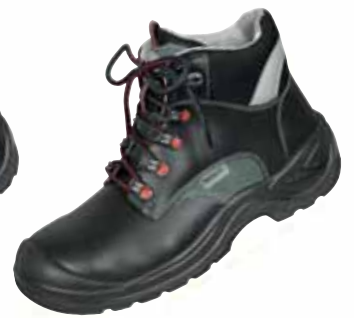
„FORMAT“ S3-Sicherheitshochschuh Größe 38 bis 48