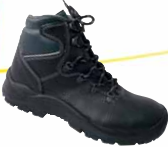
„STABILUS 3609“ S3-Sicherheitshochschuh Größe 39 bis 47