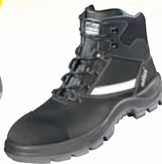
„ATLAS ALU-TEC 565 XP“ S3-Sicherheitsschuh Größe 36 bis 49