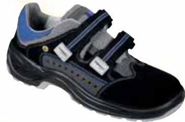
„FORMAT“ S1-Sicherheitssandale Größe 36 bis 48