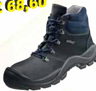
„ATLAS DUOSOFT 735 HI“ S3-Sicherheitshochschuh Sohle für Garten- u. Land- schaftsbau Größe 39 bis 48