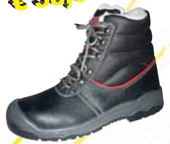
S3-HOCHSCHUH M. FELL Größe 39 bis 48