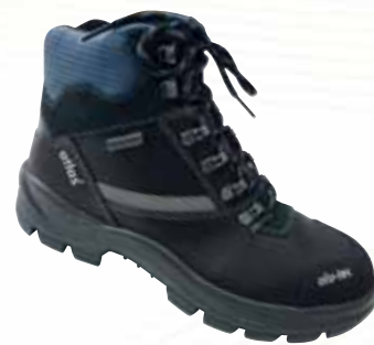
„ATLAS ALU-TEC 735 XP“ S3-Sicherheitshochschuh Größe 36 bis 50