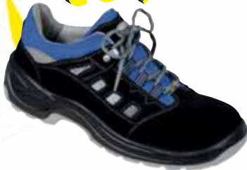
„FORMAT“ S1-Sicherheitsschuh Größe 36 bis 48