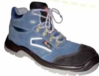
„LACROSSE“ S1-Sicherheitshochschuh Größe 38 bis 47