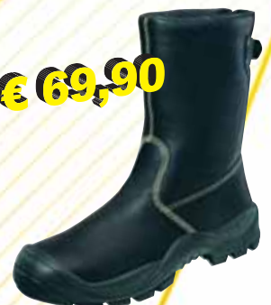
„ATLAS DUO SOFT 910“ S3-Schweißerstiefel Größe 39 bis 47