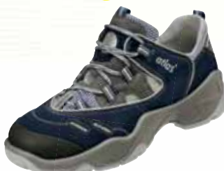
„ATLAS CF 4 BLUE“ S1-Sicherheitsschuh Größe 36 bis 49