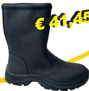
„WINTER SCHLUPF M. FELL“ S3-Sicherheitsstiefel Größe 39 bis 47