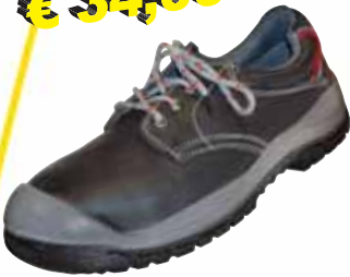
„HAITI“ S3-Sicherheitsschuh Größe 36 bis 48